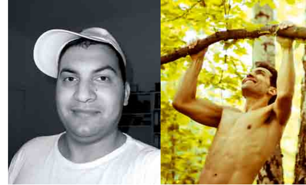
Als Fleischesser wog ich 105 Kilo: antriebsarm und zu dick.